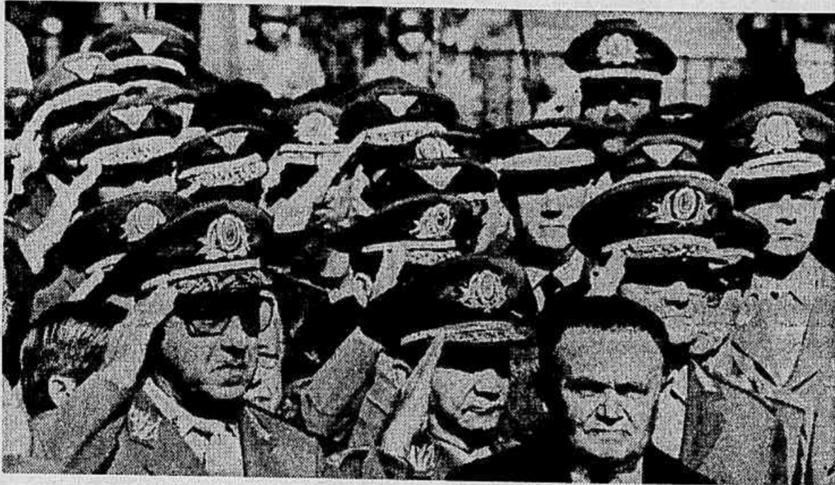
Já Presidente, civil entre seus colegas militares